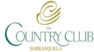
Country Club de Barranquilla